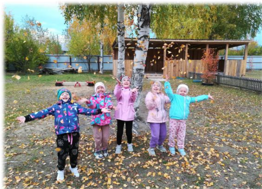
«Люблю берёзку русскую»