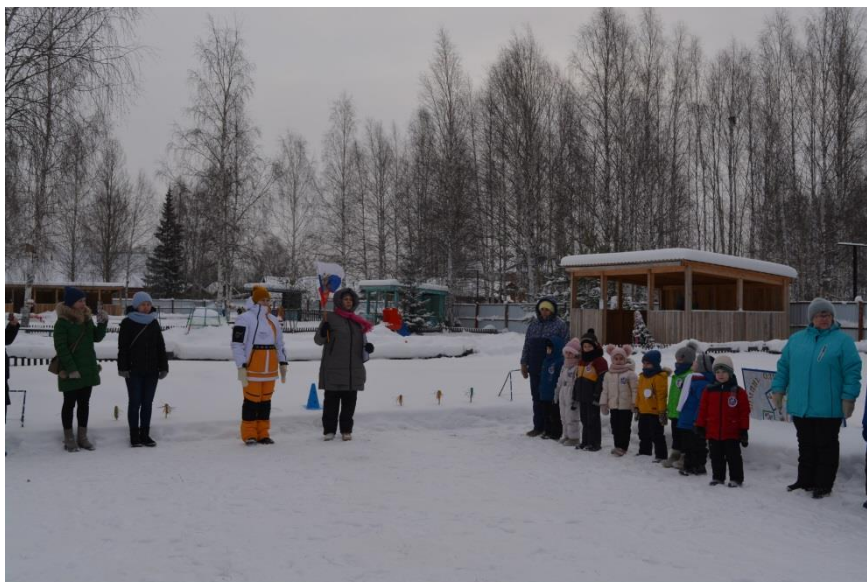
Спортивный праздник «Малые зимние Олимпийские игры»