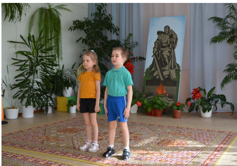
Праздник «Победа в сердцах поколений»