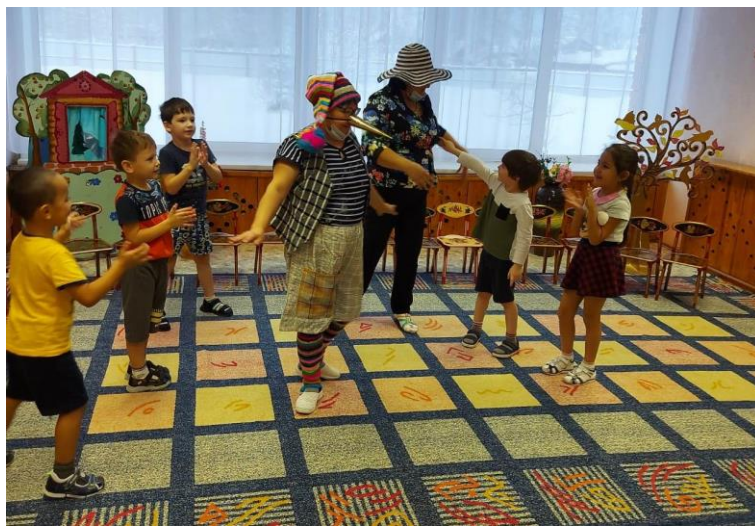
«Возьмемся за руки, друзья!»

Участники мероприятий: дети (в том числе дети с ограниченными возможностями здоровья), родители, педагоги, сотрудники Дома культуры «Импульс», учащиеся школы, сотрудники пожарной части, детской библиотеки и лесничества.