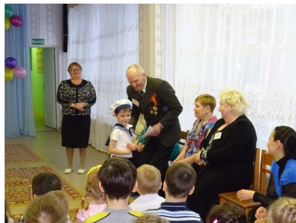
«Детство, опаленное войной»