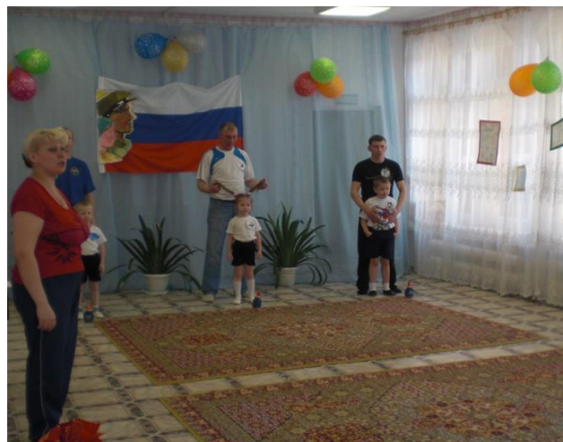
Спортивный праздник «Аты – баты, мы солдаты»