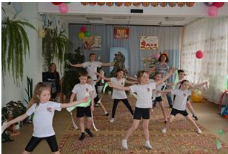
Праздник «Победный май»