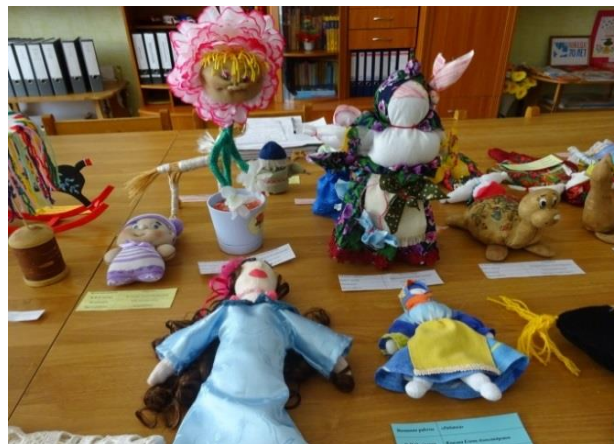
Конкурс «Народная игрушка» (работы детей и родителей)