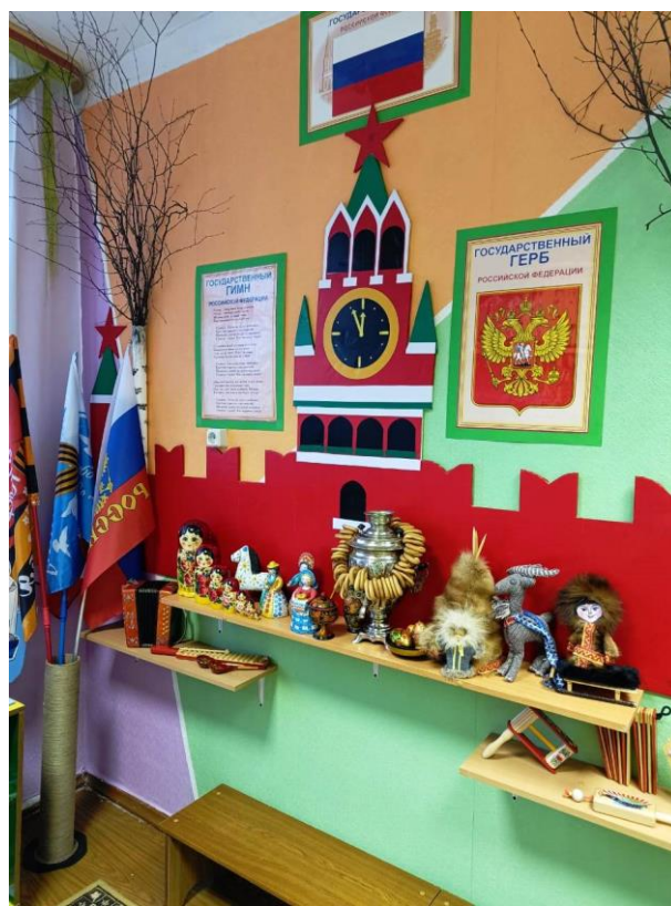
«С чего начинается Родина?»