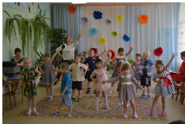
«Как дети землю спасали»