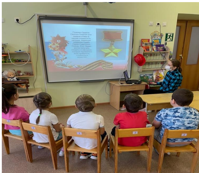
Уроки мужества «Эхо войны»