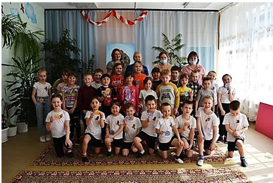
«Помню! Горжусь! Благодарю!»