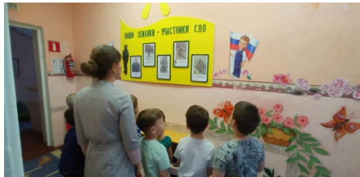
«Герои нашего времени!»

Участниками мероприятий являются дети от 3 до 7 лет, в том числе с ограниченными возможностями, педагоги, родители, военнослужащие срочной службы (после увольнения в запас), представители поколения «Дети войны», сотрудники Дома культуры «Импульс», сотрудники детской библиотеки.