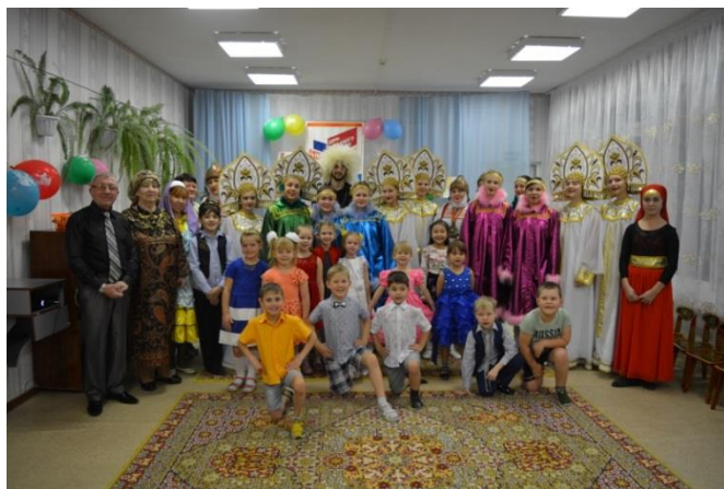
«4 ноября - День народного единства»