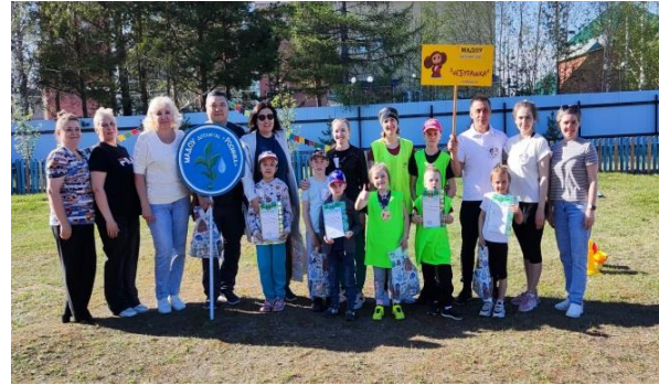
Спортивный праздник с эстафетами «Папа, мама я спортивная семья»