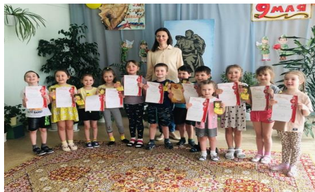
Конкурс чтецов «Мы растем под мирным небом»