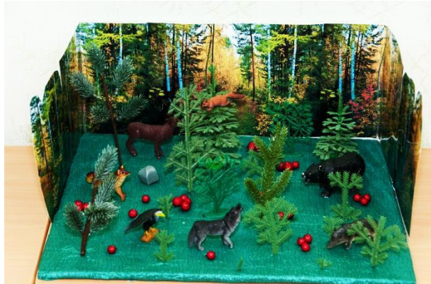
«Хочу все знать!»