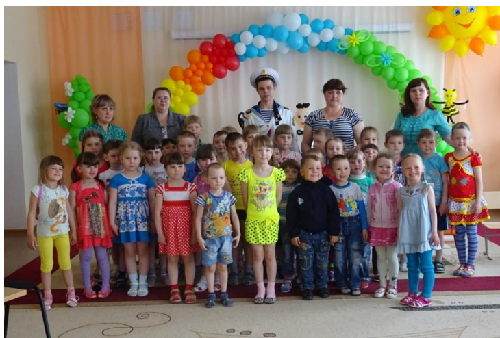
Встречи с интересными людьми