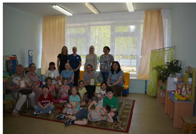
Квест - игра «Станция знаний»