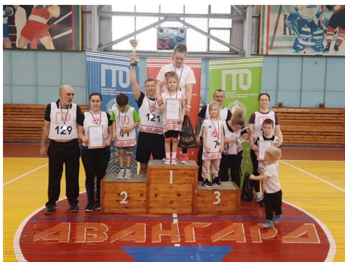
Сдача нормативов ГТО