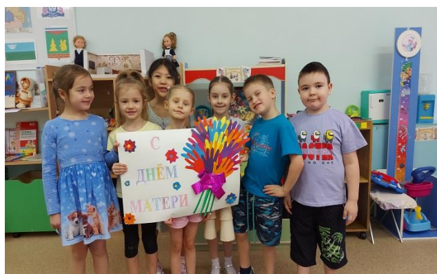
Поздравления к празднику «День матери»