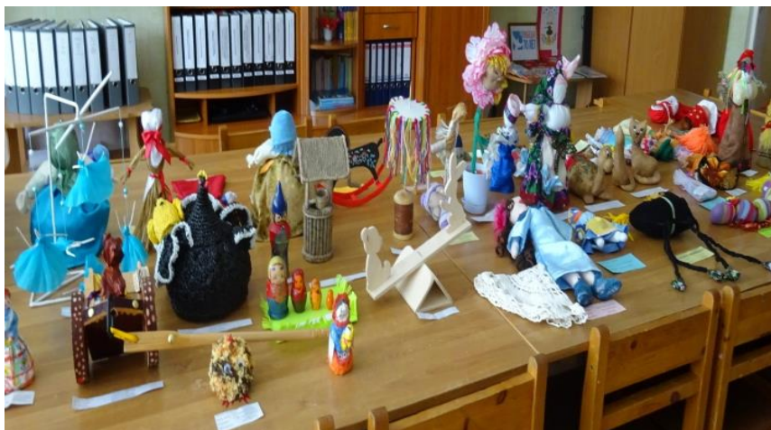
Конкурс – выставка «Народная игрушка»