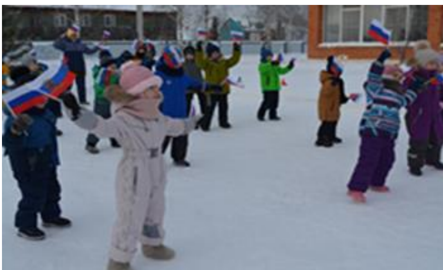
Спортивно - музыкальный праздник «День защитника Отечества»