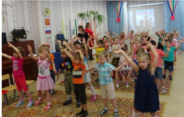
«Когда мы едины, мы непобедимы!»