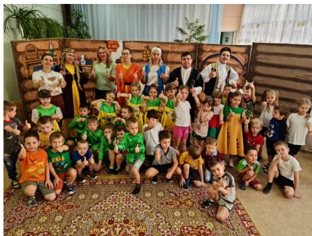
«В единстве - сила!»