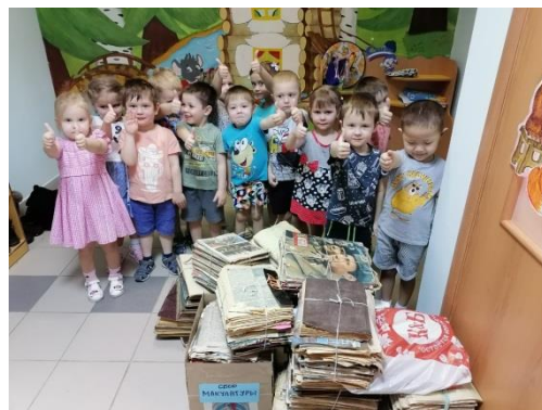
«Собери бумагу – спаси лес!»