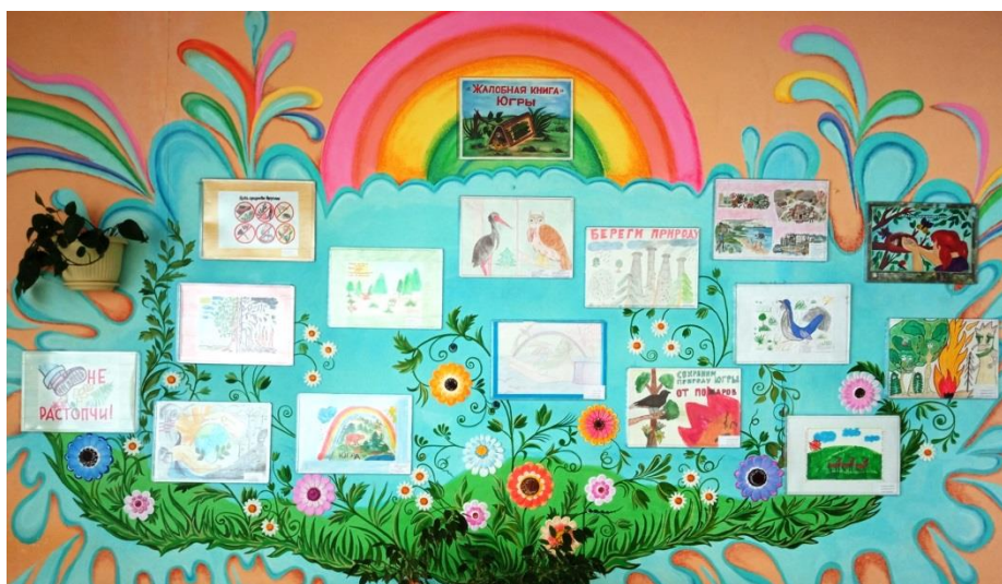
«Жалобная книга Югры»