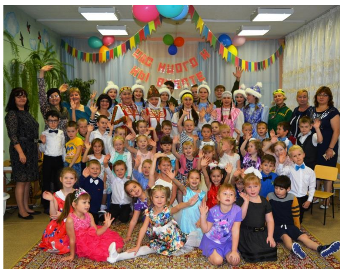
«Нас много и мы вместе!»