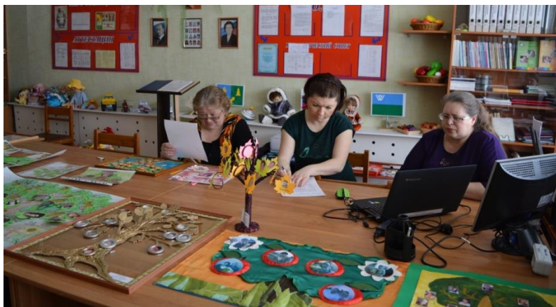
Конкурс генеалогическое древо «Моя семья» (работы детей и родителей)