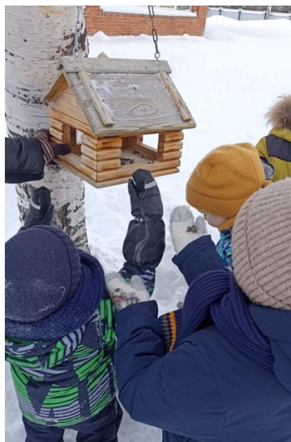
«Покормите птиц зимой!»