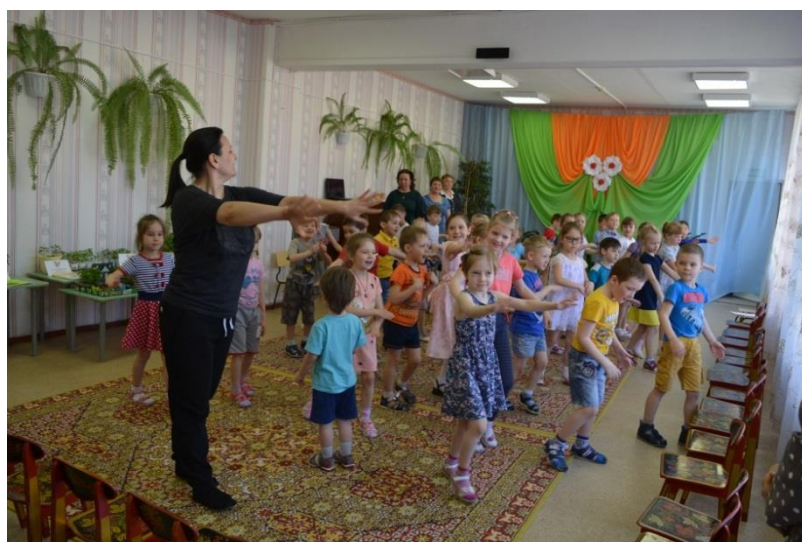
«Мы – друзья природы»