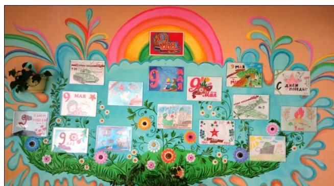
Выставка рисунков родителей и детей «День Победы!»