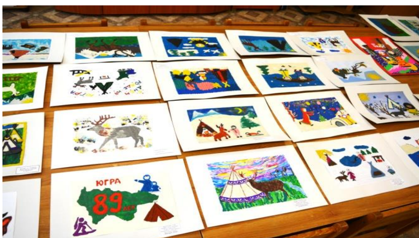
Выставка рисунков «Моя Югра»