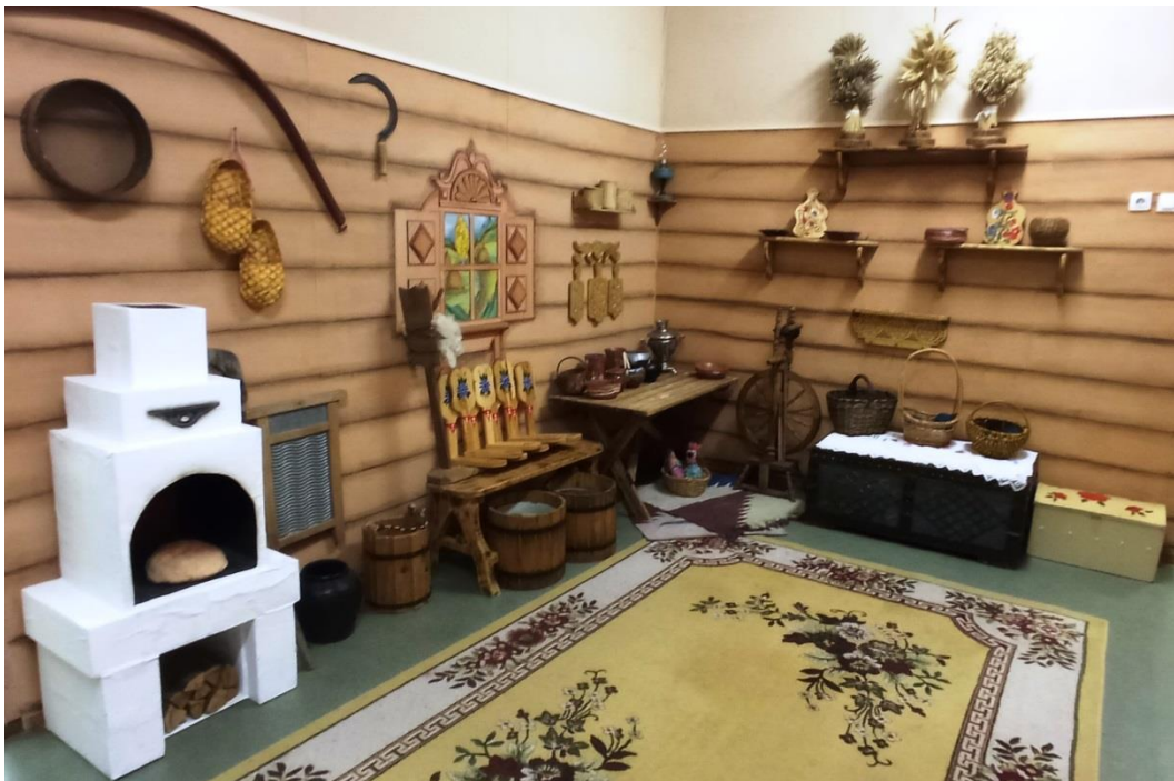
«Уголок русской избы»