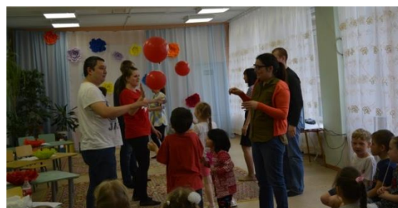
Мероприятие «Международный день семьи»