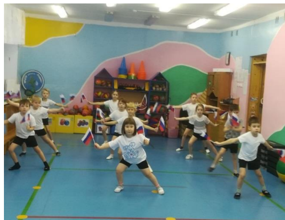
Флешмоб «День Флага»