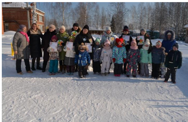
Спортивные эстафеты «Весенние старты»