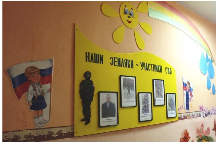
«Наши земляки – участники Специальной Военной Операции»