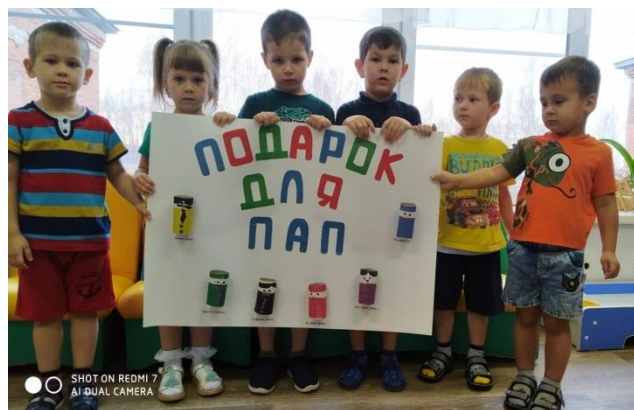
Поздравления к празднику «День отца»