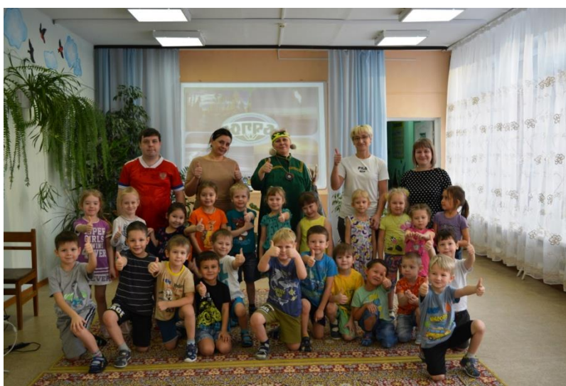
«С днём рождения Югра»