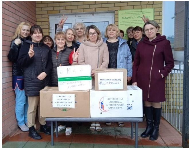
Акция «Посылка солдату»